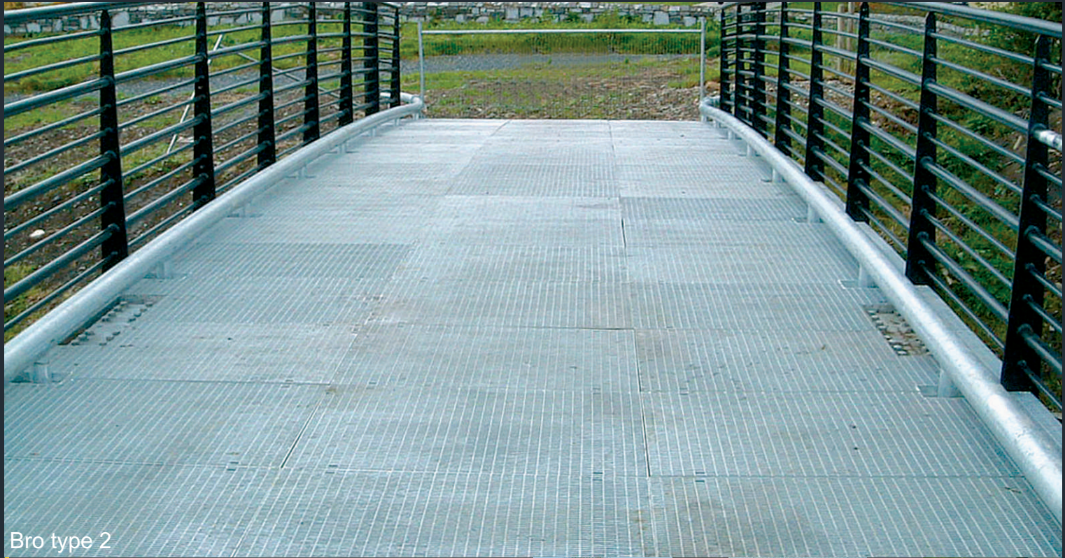
Bro type 2