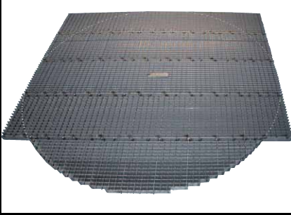
Opmærkning og tilskæring af riste til ønsket facon