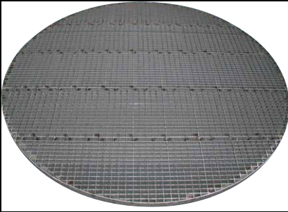
Færdigt resultat med påsvejst kantstål